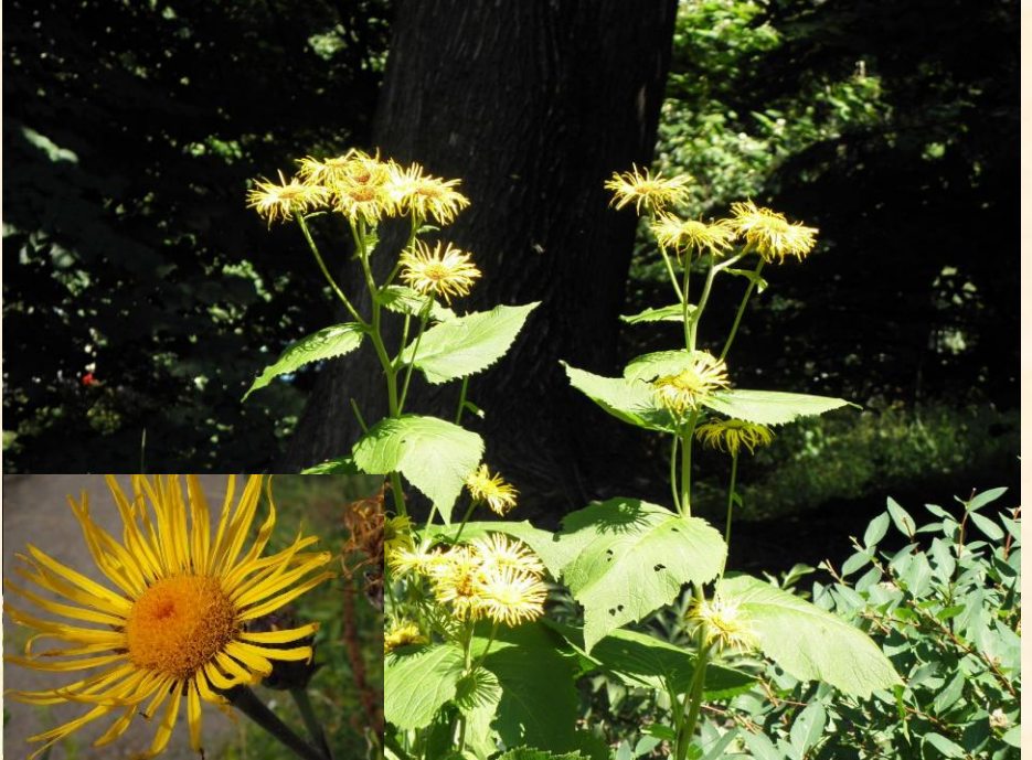
Inula helenium var. orgyalis