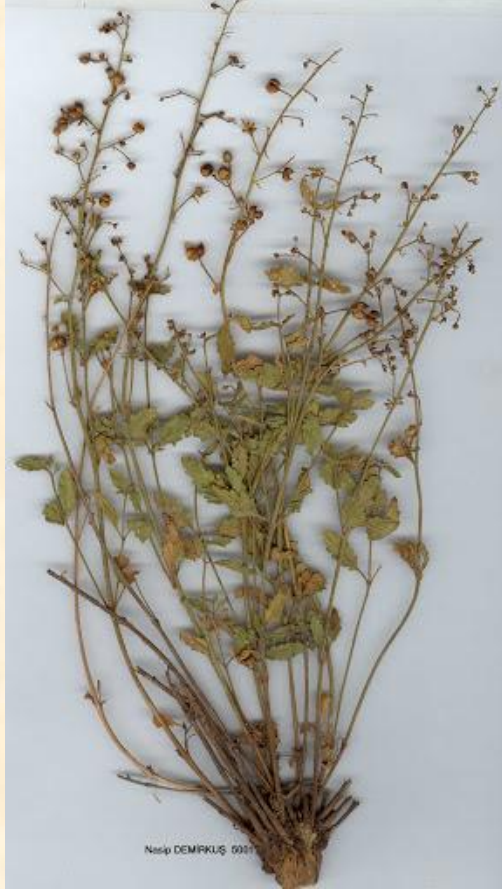
Scrophularia libanotica var. libanotica subsp. urartuënsis