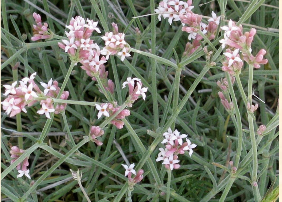
Asperula stricta subsp. latibracteata End.

Bulunduğu iller: Mardin, Amasya, Ankara, Erzurum, Kahramanmaraş, Muş, Nevşehir, Niğde, Trabzon, Karaman.