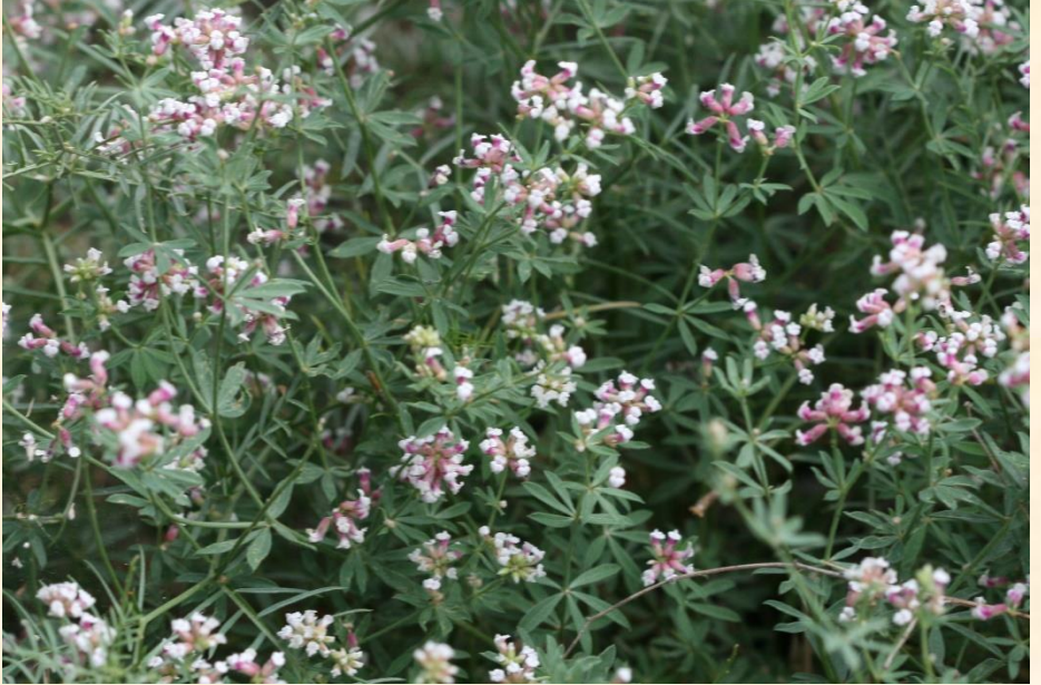
Dorycnium pentaphyllum var. haussknechtii