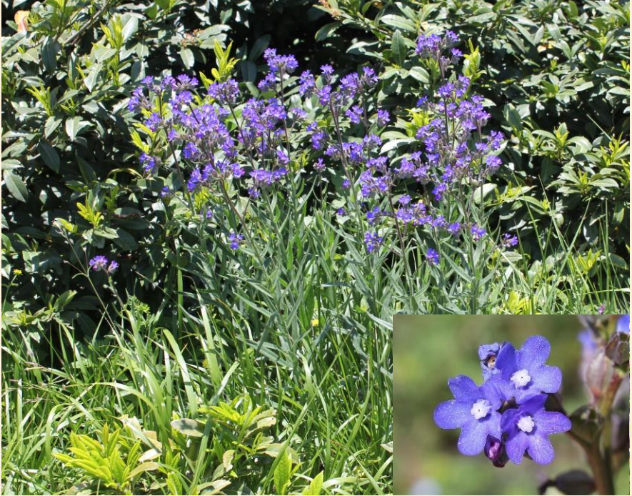
Anchusa leptophylla var. incana