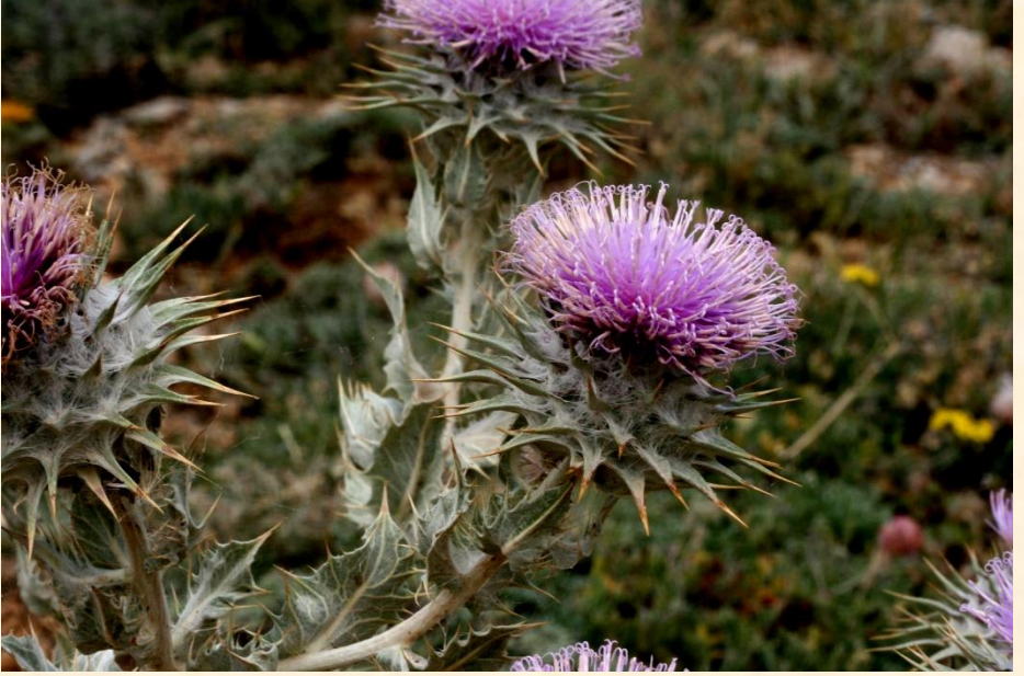
Cousinia eriocephala End.

Bulunduğu iller: Kars, Hakkari, Mardin, Batman, Erzurum, Kahramanmaraş, Muş, Sivas, Tunceli, Van