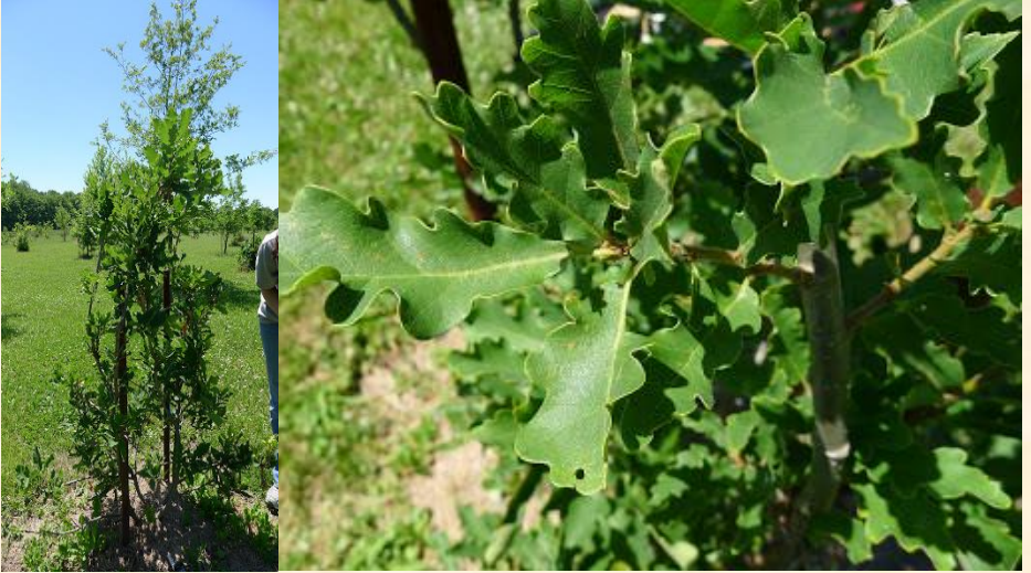
Quercus macranthera var. sypirensis