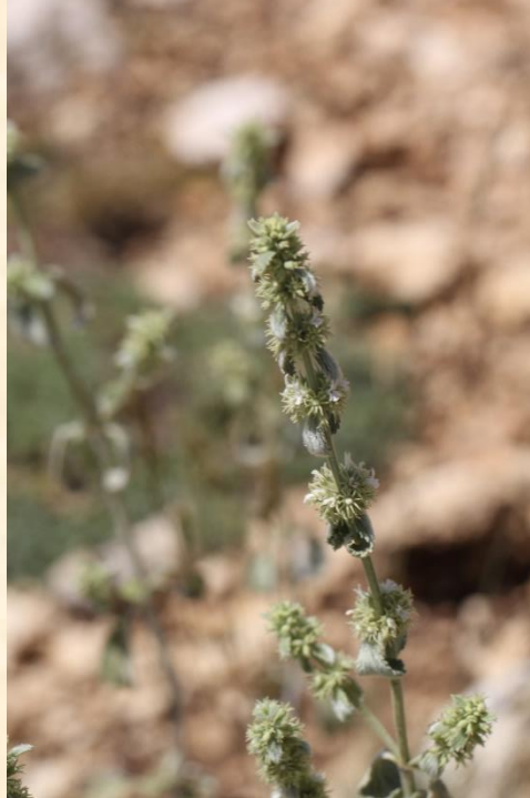
Marrubium parviflorum var. oligodon

Bulunduğu iller: Muş, Erzurum, Gümüşhane, Van.