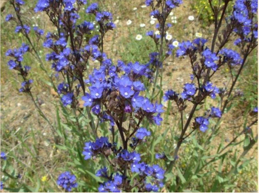
Anchusa leptophylla var. tomentosa