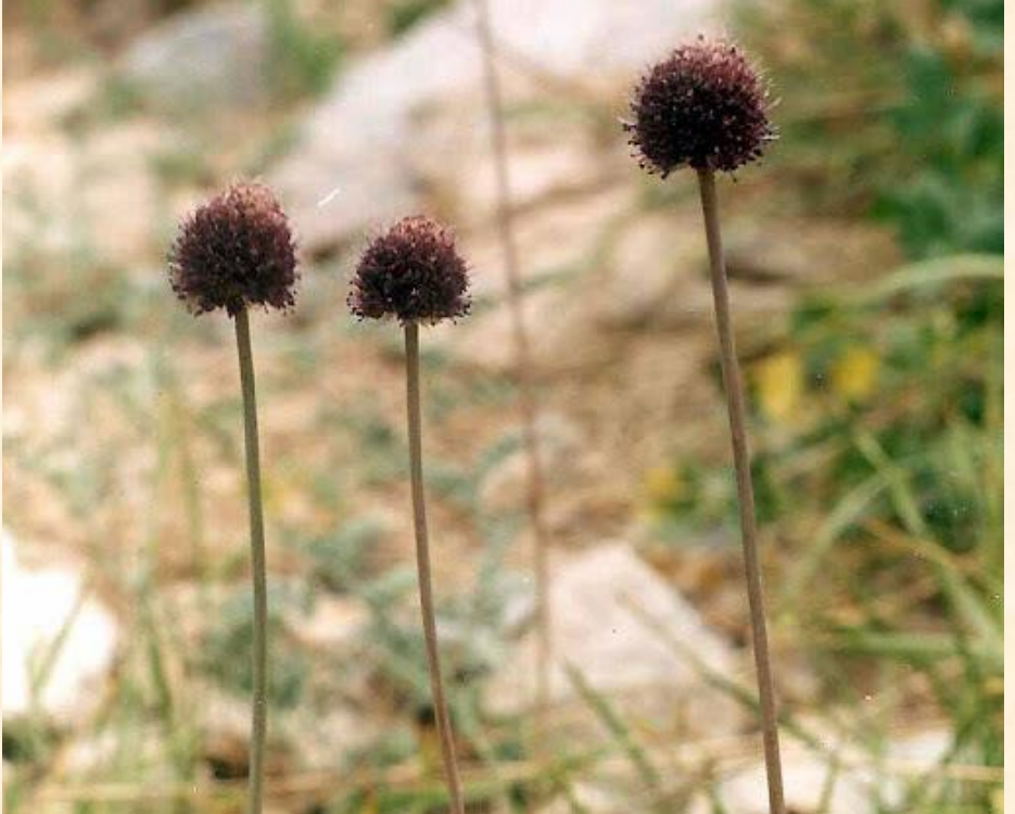
Allium stearnianum var. vanense