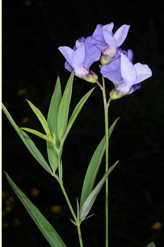
Lathyrus cyaneus subsp. pinnatus