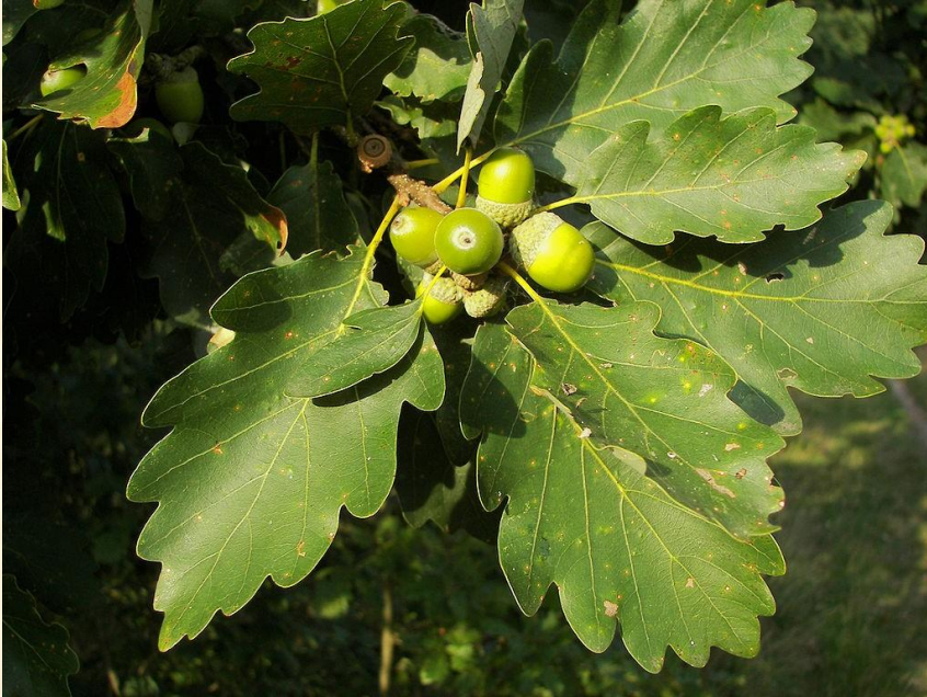
Quercus petraea var. pinnatiloba

Bulunduğu iller: Muş, Tunceli, Van, Bingöl, Hakkari, Elazığ.