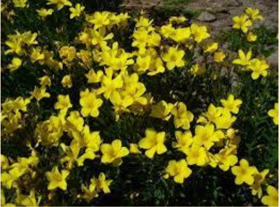
Linum flavum var. scabrinerve