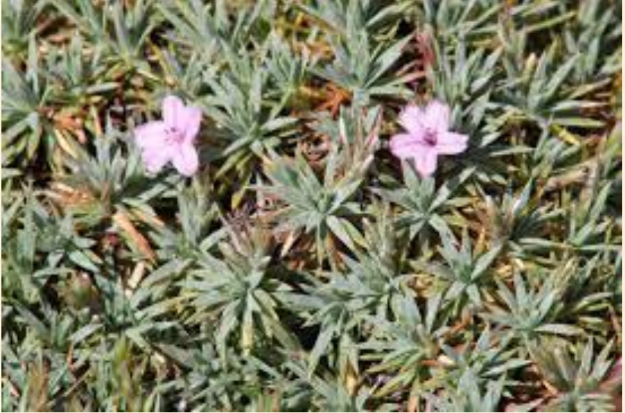
Acantholimon calvertii var. calvertii